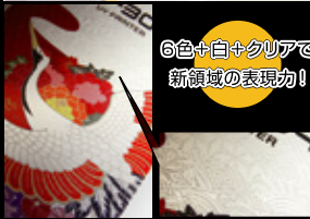
6色+白+クリアで新領域の表現力!

従来モデルよりインクスロットが 2 基追加され、6 色のインクがセットできるようになりました。4色に比べてより高精細で美しい階調処理を実現。さらに、ホワイトやクリアインクを加えることにより、「透明素材への白インク裏打ち」や「光沢仕上げ」「マット仕上げ」など多様化するニーズに、高級感の豊かな表現力に対応できます。