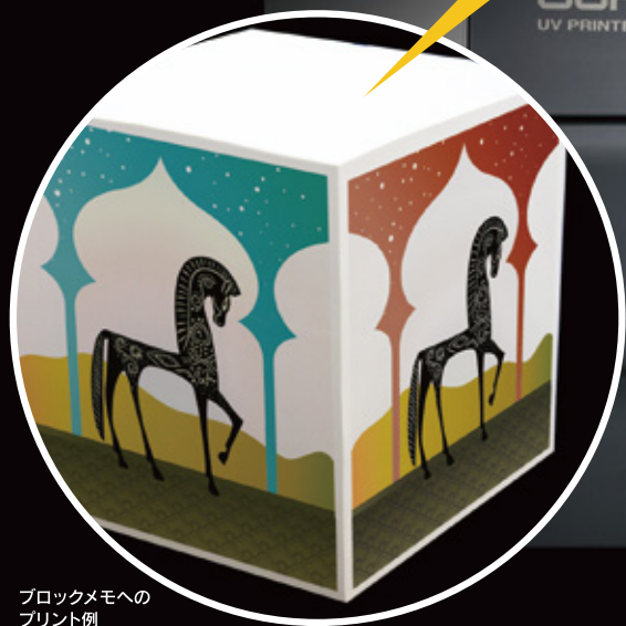
ブロックメモへの プリント例