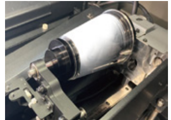
傾斜のある素材のセット