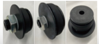
素材固定用専用チャック（標準添付）