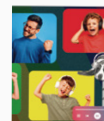
インクセーブ レベル 5 (約 50% 削減)