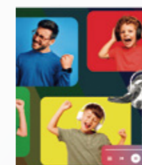
インクセーブ レベル 3 (約 30% 削減)