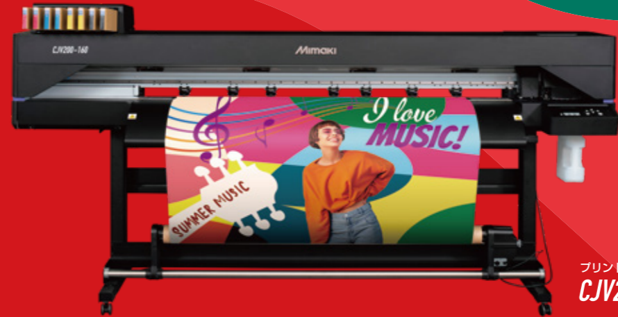
プリント&カット機 CJV200