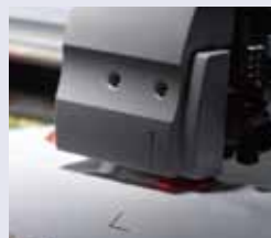
トンボ位置を容易に合わせられる「ライトポインタ」

プリントした印刷物のトンボを自動で連続的に読み取り、個々に自動補正しながら複雑な形状も正確に輪郭カット。最大4点のトンボ読み取りにより、印刷時やラミネート時のゆがみも補正しながらより高精度なカッティングを実現します。