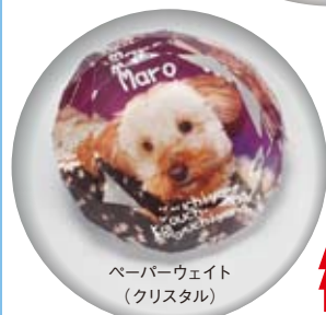
ペーパーウェイト (クリスタル)

記念品やお祝い品、ノベルティ用品にオリジナルグッズ 版レス&ダイレクトプリントで小ロット・多品種生産を 美しく短納期で仕上げます。