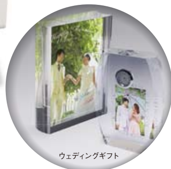
ウェディングギフト