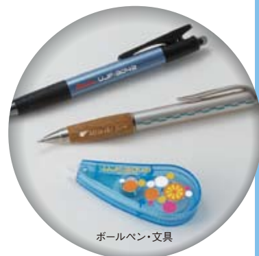
ボールペン・文具