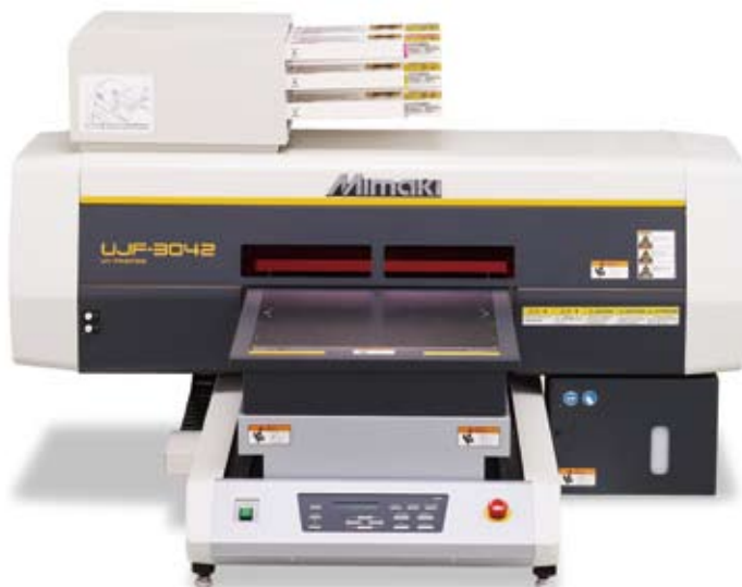
※専用インク6本 (C、M、Y、K、W×2) と専用ソフトを同梱 税込価格3,465,000円