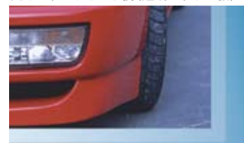
4色のみ すべての色に光が透過するため、カラー映えがしない。

透明または有色素材にフルカラープリントする場合に活躍する白インク。UJF-3042は白×フルカラーを一度で行うプリントヘッドを搭載し、効率よく白インクの裏打ちを行うことができます。