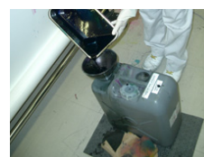
e.g. Pouring the waste liquid into the tank.