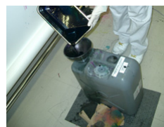
作業例 インク廃液移し変え