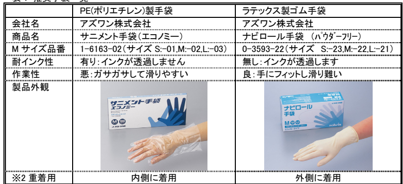
表 1 推奨手袋一覧