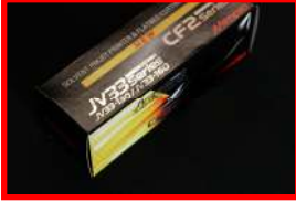
パッケージモックアップ、各種 POP