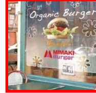
ウインドウサイン