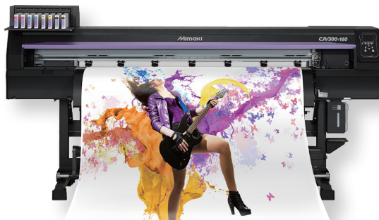
1ヘッドタイプのエントリーモデル「CJV150」シリーズもご案内致します。