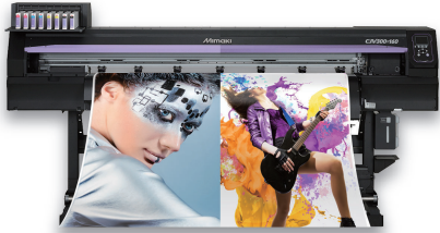
※会場では CJV300-130 を展示します。