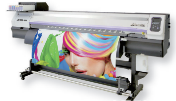
※会場では JV150-130 を展示します。

※SS21 インク、ハイコンプロファイルは JV300/150・CJV300/150 シリーズに対応します。