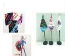
ハンドタオル / ミニフラッグ