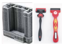
ミニチュア・試作