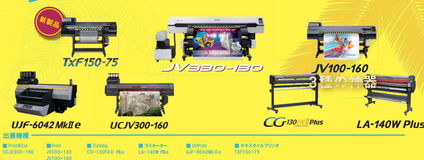
新製品 TXF150-75 JV330-130 JV100-160 UJF-6042 MkII e UCJV300-160 CG-130FXII Plus LA-140W Plus 3種の神器 Print&Cut UCJV300-160 Print JV330-130 JV100-160 Cutting CG-130FXII Plus ラミネーター LA-140W Plus UVPrint UJF-6042MkII e テキスタイルプリンタ TXF150-75