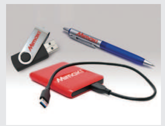
文具・ノベルティ