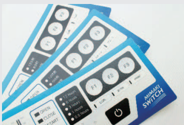
メンブレンスイッチ