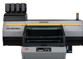
UJF-6042 Mk II e