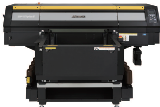
UJF-7151 plus II