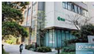
デモセンター入口外観

◆受付 株式会社ミマキエンジニアリング JPデモセンター 東京都品川区北品川5-5-25 Sumビル2F