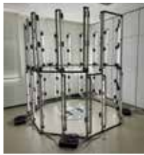
全身スキャナー FacTrans for Full Body

MIMAKI がこれまで培ってきたプリンタテクノロジーを結集！ UV 硬化インクジェット方式で 1,000 万色以上のフルカラー造形を実現！