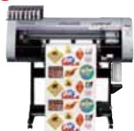
プリンタカッター CJV30Series