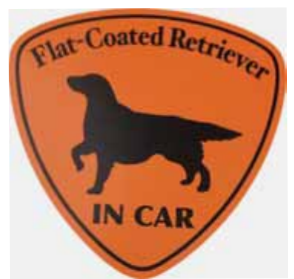
オリジナルステッカー