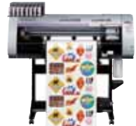
プリンタカッター CJV30Series