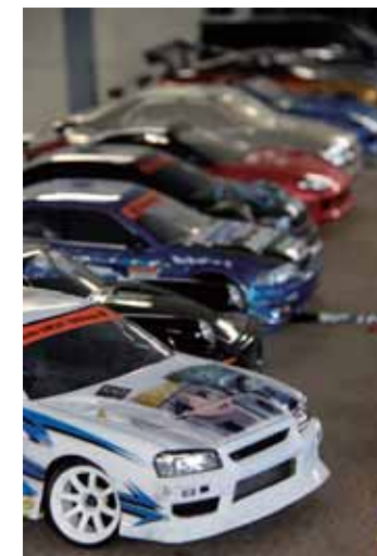
ラジコンへのバイナル