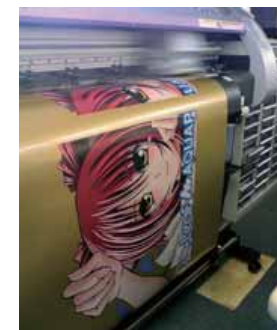
ゴールドメディアにカラー+白印刷