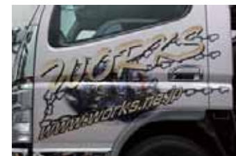
トラックへ施工 透明メディアに印刷