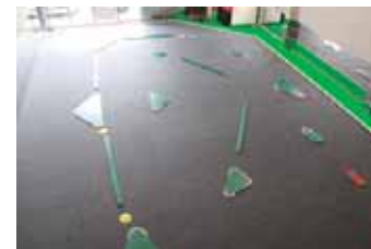
店内のラジコンコース