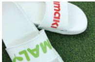
オリジナルグッズ