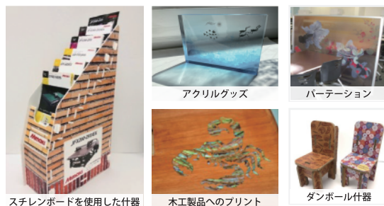
ステンレボードを使用した仕器