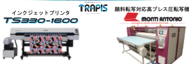
インクジェットプリンタ TS330-1600