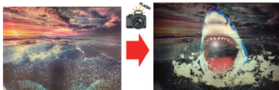
フラッシュ撮影で意匠が現れるフラッシュプリント