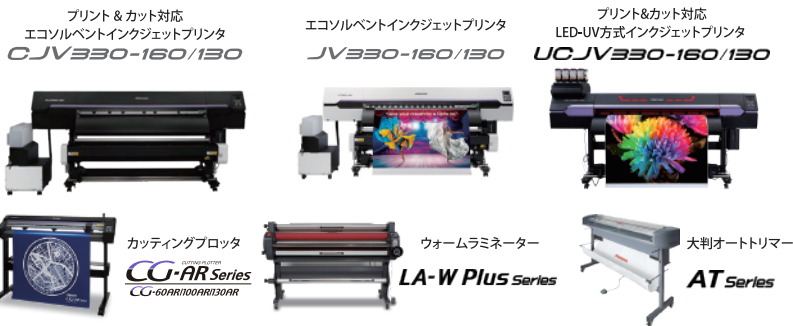
プリント&カット対応 エコソルベントインクジェットプリンタ CJV330-160/130